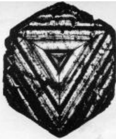
Gekleurde Y-ster vorm in Madagaskar toermalijn